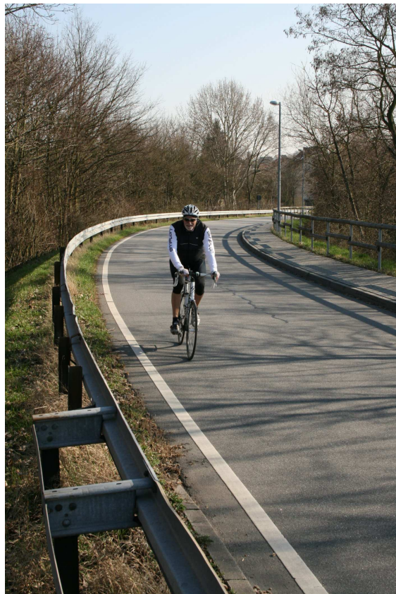
Motiv: Radsportler auf Saulach-Brücke