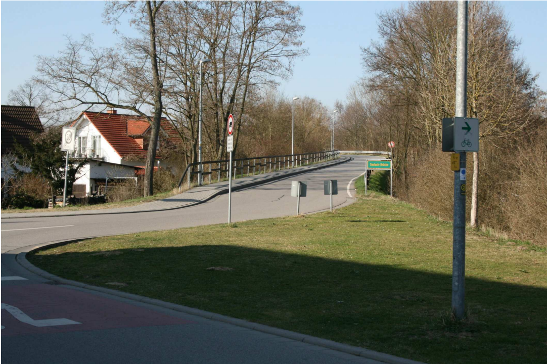
Motiv: südl. Beginn Saulach-Brücke (Höhe Parkplatz Friedhof)