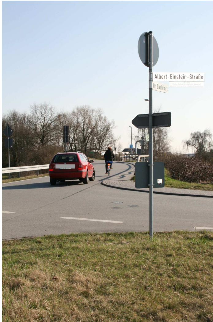
Motiv: Konfliktpotenzial Pkw/Radfahrer im Bereich der Saulach-Brücke